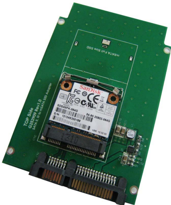
CB963FAH + Half size mSATA SSD